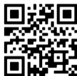
หนังสือชี้ชวน

ผู้ถือหุ้นกู้ของ SCC เฉพาะกลุ่มที่มีสิทธิได้รับการจัดสรรหุ้น สามารถศึกษาข้อมูลเพิ่มเติมและดาวน์โหลดเอกสารสำหรับการจองซื้อหุ้นสามัญเพิ่มทุนของ SCGP ที่เว็บไซต์ www.scgpackaging.com และสามารถดาวน์โหลดหนังสือชี้ชวนเพื่อการเสนอขายหุ้นสามัญเพิ่มทุนของ SCGP ในครั้งนี้ได้ที่เว็บไซต์ของสำนักงานคณะกรรมการกำกับหลักทรัพย์และตลาดหลักทรัพย์ ( www.sec.or.th )